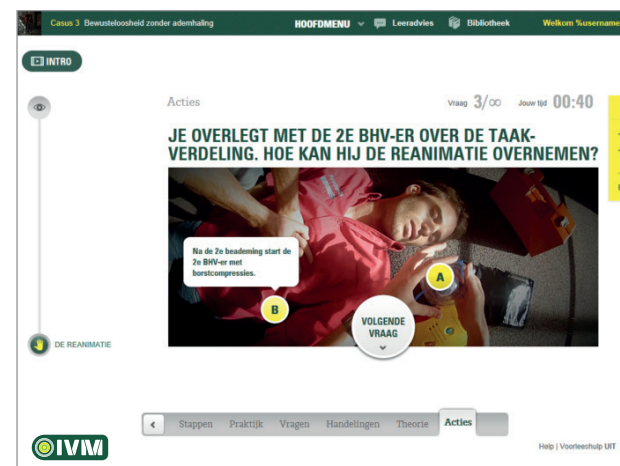
SCREENSHOT IVM ONLINE LEREN